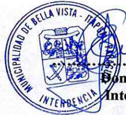
Don Euclides De Godois Don Euclides De Godois Intendente Municipal